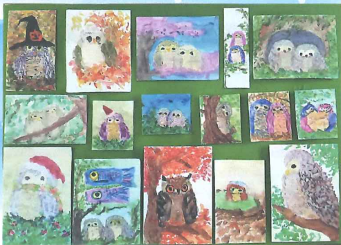
ふくろうの詩 近藤 加代子(大阪府)