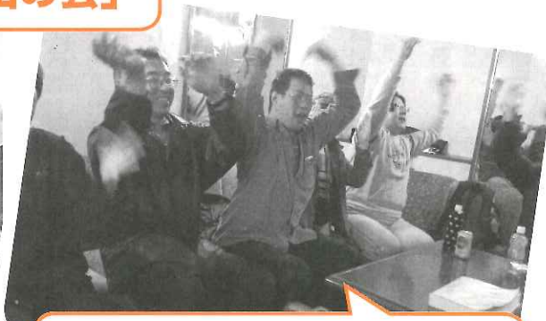
♪ Y・M・C・A ~ ♪ カラオケで、もりあがりました

あか たてやま かい しこと 「明るい立山の会」では、仕事 や、生活、趣味、悩みなど、いろ んなことを話しあっています。 なかま ひと 仲間をつくりたい人、いろんな はなし ひと けんたいかい かつやく 話をしたい人、県大会で活躍した ひと、ぜひ、一緒に活動しません か?お待ちしております!