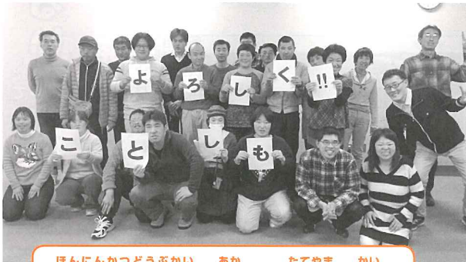
ほんにんかつどうぶかい あか たてやま かい 本人活動部会「明るい立山の会」