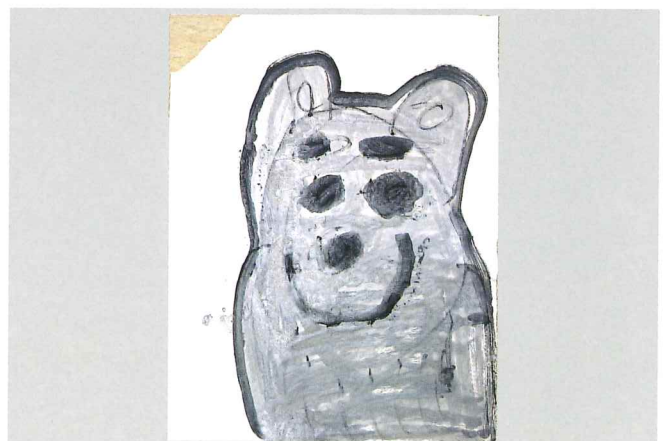
いぬ (あすなる・H・Rさん)